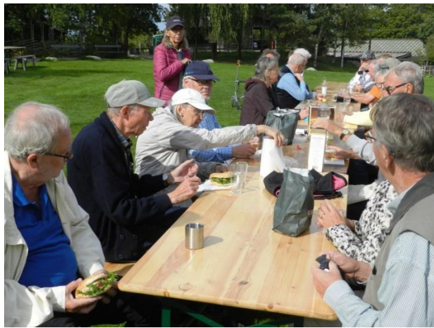
Nygjorda tonfiskmackor och ostmackor kunde avnjutas till både rött vin, vitt vin och bubbelvatten.