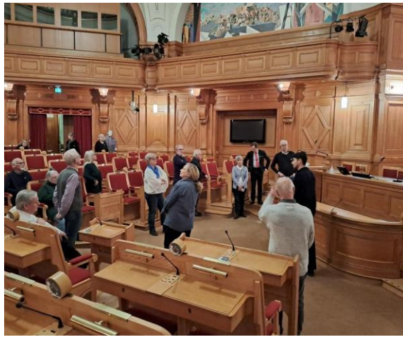
I den östra byggnaden som tidigare var hela riksdaghuset med båda kamrarna så fick vi gå in i 1:a kammarens plenisal . Det pågick möte i salen som tidigare varit 2:a kammarens sal.