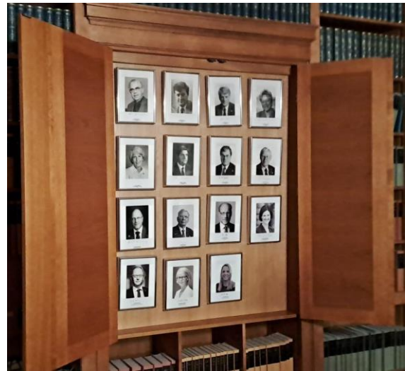
Finansutskottet hade gått hem för dagen så vi kunde beundra en helt fantastisk inredning med bokhyllor i ädlare träslag.