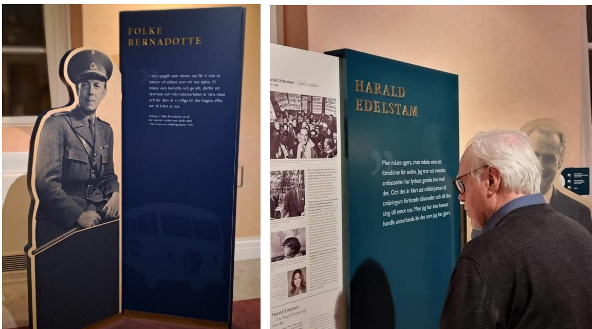
Förutom inredning och konst kan man studera en del mindre utställningar i riksdagshuset. Efter att ha stannat till i Kvinnorummet så kom vi till De goda gärningarnas rum med idel kända ansikten. Men bara män?