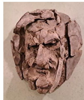
Statsministrar får själv välja konstnär som för avbildning. Tre känner man lätt igen, men vemär den högra?