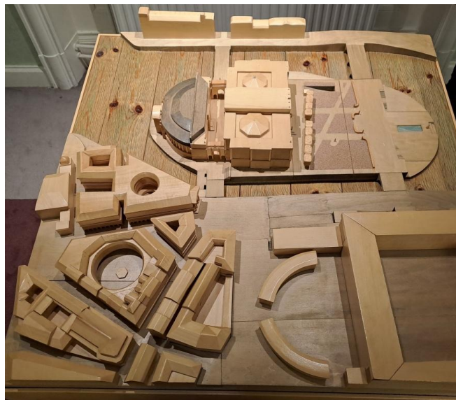
"Nådiga luntan" fick vi också känna på. Modellen med alla byggnader som riksdagen förfogar över väckte självklart extra stort intresse hos MAS webbredaktör. Nu vet vi också var riksdagen har sitt eget gym.