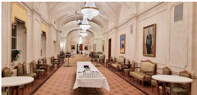
I det som kallas sammanbindningsbanan förbereddes någon form av fika och fick bara titta in.